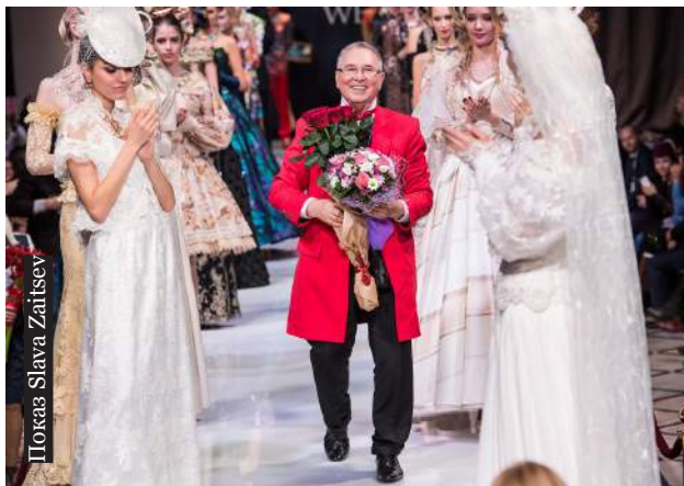
Показ Slava Zaitsev